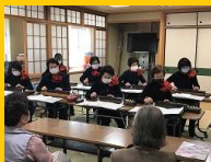
ふれあい食事会(4月)