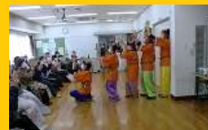
ふれあい食事会(1月)