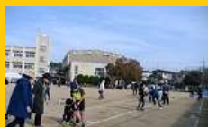
ゲームフェスティバル(11月)