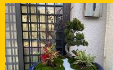
松竹梅寄せ植え(12月)