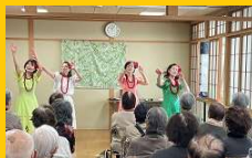
ふれあい食事会(11月)