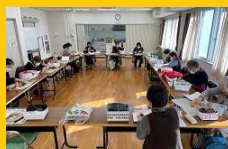
クリスマスリース作り(11月)