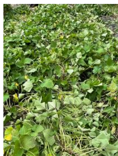
夏のサツマイモ畑

焼き芋大会のさつま芋は、今年もふれまち役員で春に苗を植えて育てたものを使います。焼き芋は例年より多いもみ殻を準備して早朝から火起こしした燻炭器2台を使ってもみ殻の中にさつま芋を入れて焼きます。焼きあがるまでの間は、ボッチャーをして楽しみます。