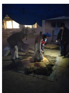
まだ暗い頃に火入れ